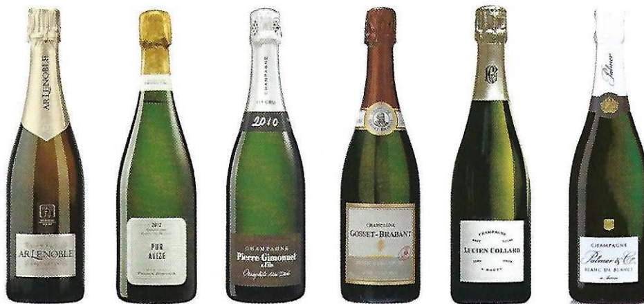
De gauche à droite : Champagne AR Lenoble « mag 14 Brut Nature », Champagne Franck Bonville « Pur Avize 2012 », Champagne Pierre Gimmonnet & Fils « Oenophile Non Dosé 2010 », Champagne Gosset-Brabant « Réserve Grand Cru Brut Nature », Champagne Lucien Collard « Brut Nature », Champagne Palmer & Co « Blanc de Blancs ».